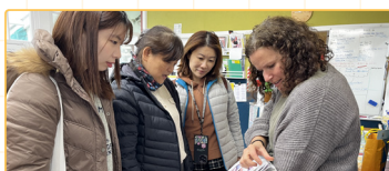
▲參訪幼兒教育機構，與家長交流，了解運作模式與教育理念