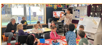
▲台灣文化課程教學—剪紙藝術