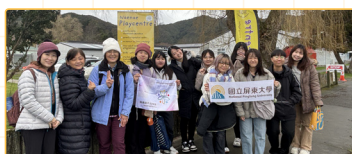
▲參訪幼兒教育機構，與家長交流，了解運作模式與教育理念

Step out with courage, connect through language, embrace diversity with an open mind.