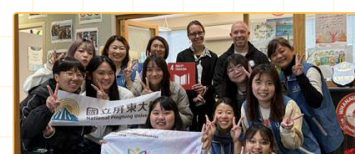
▲與KNS校長及副校長合照