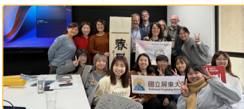
▲拜訪教育部，交流兩地政策與文化特異與物理環境設計