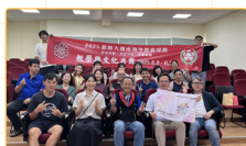
▲見習師資生與胡臺校指導教師相見