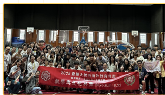
▲「破解臺灣各大學科系密碼」活動合照

在教育見習的過程中，最深刻的印象與體會是：「差異化教學在多語文化中的真實運作」。由於胡臺校學生背景多元，不僅語言能力不一，學習經驗與文化脈絡亦有所差異。即便如此，當地教師能透過彈性調整教學節奏、分層任務設計、情境引導與提問策略，讓不同程度的學生都能參與並完成學習目標，讓「理解」成為教學的核心，而非僅是為了將一堂課程完成。此外，在見習的過程中，課堂班級中的融洽師生關係、尊重與信任的氛圍，都讓我們意識到：「學習的動力往往不僅僅只是透過教學產生，而是由關係的建立所促成。」這段經驗也讓我們了解，教育現場的關鍵，從來不是教材，而是「看見學生的差異，仍願意等他們一起抵達」。