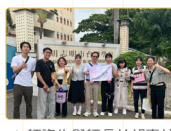
▲師資生與師長於胡臺校門口前的紀念合影