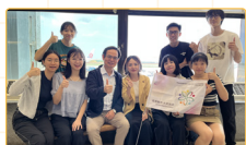
▲「臺灣夢·越南行」預備啟航

本計畫由臺師大師資生赴越南胡志明市臺灣學校(TSHCMC)進行兩週教育見習。見習內容涵蓋課堂觀察、試教演示、校務行政支援、文化交流活動設計與跨校參訪。見習期間，見習師資生透過課前備課、課中教學實作、課後回饋晤談，建構教學現場的真實學習，直接參與教育現場運作，並藉由多元文化與跨國教育情境，提升見習師資生教學專業能力、文化敏感度與教育現場的應對能力。