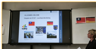
▲德國校方介紹與台科合作

執行特色在於「理論與實務結合」，師資生不僅觀摩德國高品質的職業教育課程，更實際入班設計並執行教學。課程緊扣「SDGs 永續發展目標」並融入「AI 數位工具」邏輯思維教育，涵蓋品格教育與社會情緒學習，透過實作與當地師生進行深度的跨文化教學交流。