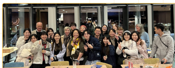
▲與德國校方聚餐合影