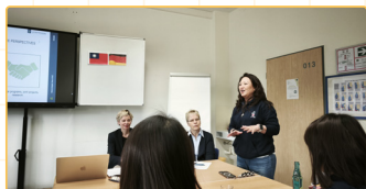
▲台科與校方展示合作內容