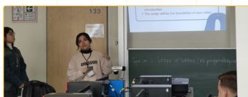
▲臺灣師培生進行數位學習教學