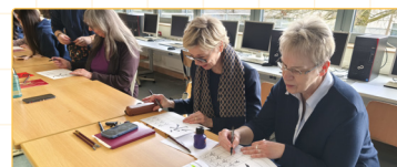
▲德國方教師體驗臺灣文化