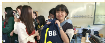
▲德國校方贈送相關生活用品