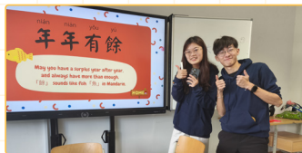
▲臺灣師培生進行教學