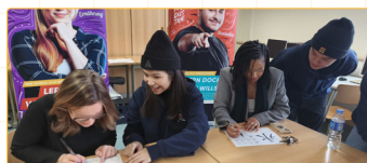
▲臺灣文化介紹交流

然而，在每日的反思與討論中，我們學會了放下預設立場，重新解讀德國學生專注、沉穩的非語言反饋。這個「從文化衝擊到教學調適」的歷程，讓我們深刻體會到，教育並無標準答案，身為教師必須具備文化敏感度，學習尊重並適應不同的學習風格。