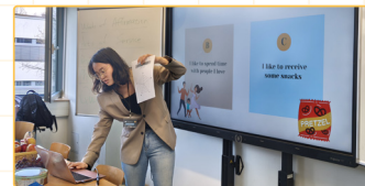
▲臺灣師培生進行課程教學