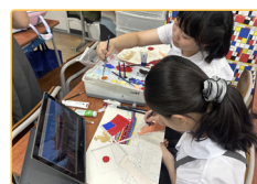
▲實習生進行台灣文化的繪畫課程