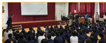
▲學校每月召開週會，有頒獎、中心德目和學生會會長選舉等活動。

此段實習經驗凸顯在多語環境中調整表達方式的重要性，並反映教育的核心在於理解差異、連結人心，同時在文化交融中呈現教育的真實價值與溫度。