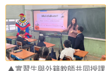
▲實習生與外籍教師共同授課