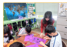
▲實習生進行萬聖節藝術教學