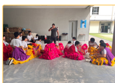
▲實習生參與觀課-舞龍舞獅文化課

師資生 | 帶著熱情去遠方，在多語的教室裡，你會發現教育比想像中更有色彩、更有故事。去感受、去觀察、去交流——你會發現教育的可能性無限大。