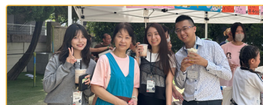
▲實習生與大阪中華學校主任、大阪中華學校替代役於園遊會進行合影