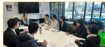
▲建構議課、導師回饋與共備機制