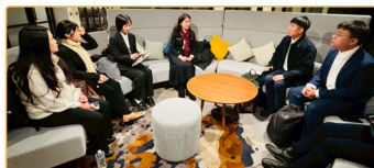
▲導師與師資生共備會議與修正會議

本計畫以「在地深耕、國際接軌」為核心，透過數位學習與移地教學結合 CLIL 模式，培育具全球視野與創新教學力的雙語師資。師資生在見習期間與澳洲導師共同備課、觀課與議課，實踐教育共好的精神。返臺後持續參與教學研究與資源共享，建立雙語教學實踐社群。計畫強調長期陪伴與人才培育，讓師資生在「教學反思—課程共構—文化理解」的循環中，展現教育永續與共學成長的價值。