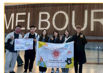
▲師資生於墨爾本機場合影