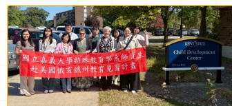
▲ Child Development Center與校長合影