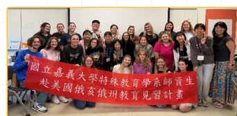
▲ Culturally and Linguistically Sustaining Pedagogy的課堂文化交流