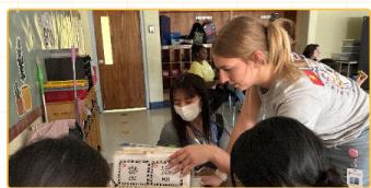
▲ 與KidsLink School特殊教育老師討論學生的IEP與教學計畫