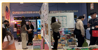
▲ Bio-Med Science Academy整合專業團隊之行為分析師與語言治療師提供教學支持

此次師資生海外教育課程，收穫良多，具體而言以「精進特殊教育教學素養、特殊教育制度理解與比較、多元文化理解與交流及擴展國際視野」四部分對師資生最具成效。師資生從特殊教育機構完整的專業團隊整合各個治療環節，為嚴重行為問題和相關需求的學生，提供廣泛的治療與學習方案，獲得不同文化視野的教學啟發，並將所學全校性正向支持方案融入臺灣特殊教育教學，豐富教學內容，提升教學品質。同時，也從雙向師生交流、學術探討與專業交流，擴展師資生的跨文化視野，增強對多元文化的理解與尊重，促進跨文化交流，累積國際合作能力。培養國際專業素養，加深全球化特殊教育議題的關注與理解。