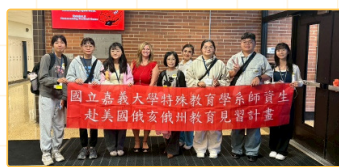
▲ Field Local Schools與校長合影

本次見習機構一共有10所，包含合作機構的附屬中心外，皆為特殊教育融合學校及特殊教育學校。參訪結果歸納為下：美國特殊教育主流趨勢為融合教育，在落實特殊教育學生學習權益與推廣融合教育方面，具體做法有：1.落實個別化教育計畫精神，整合專業團隊人員，如語言治療師、職能治療、行為分析師（BCBA）或助理行為分析師（BCaBA）等人力多元提供學習支持；2.低師生比；3.課程規劃強調自主學習、貼近學生生活經驗等；4.重視學生的表意權與合理對待；5.美國主要負責鑑定的人員包含心理師及特殊兒童協會的教育診斷人員；6.個別化教育計畫內容精簡扼要，強調學生的學習重點與學習內容。