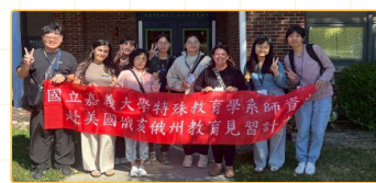
▲ Bio-Med Science Academy K-4與校長合影