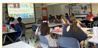
▲ 見習生介紹臺灣夜市文化與美食