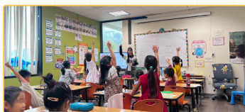
▲清大師資生與教學學生合照