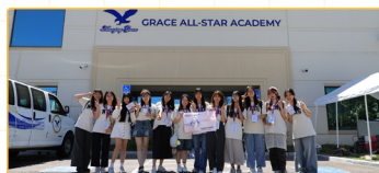
▲清大師資生於見習學校外合照

「美國加州聖地牙哥 STEAM 教學見習」計畫，在教育部補助下推動，響應臺灣 2030 雙語政策與 108 新課綱，培育具雙語專長的小學教師。此計畫延續清華大學雙語教學師資培育成果，並結合香港大學英語沉浸式實習課程及英國師培教育體制的理念，安排師資生至美國體制內學校見習，學習以 EMI (English as a Medium of Instruction) 全英語教授 STEAM 跨領域課程，並體驗當地文化、熟悉美式口語與課程設計。