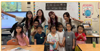
▲清大師資生與教學學生合照