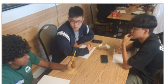
▲學生一起思考如何把英文帶到偏遠地區