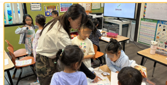
▲與學生一同討論學習單