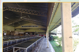
▲新民獨中的餐廳(食堂)供應多元族群文化的料理，飽足師資生的早、午餐