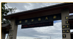
▲國際史懷哲的服務學校位於馬來西亞吉打州的雙溪大年新民獨立中學