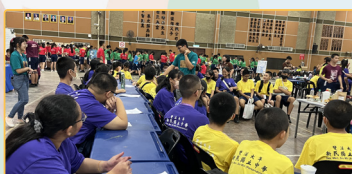
▲商美周辦理的活動，師資生擔任小組的指導員

本計畫以嚴謹遴選與系統化行前培訓（教案撰寫、PBL、跨域「香料」主題、雷雕/媒材運用）為基礎，強化師資生課程設計與數位整合能力；透過在國外的教學服務，參與學校的課內、外教學實作活動、即時調整與跨文化溝通協作；每日工作坊深化對獨中制度、語言文化與校本課程的理解；返國發表與省思紀錄建構專業檔案。整體促進跨域課程力、文化回應教學素養、國際視野與服務，並擴大校際合作能量，增益師資生國際視野與跨文化的能量。