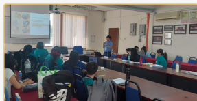
▲放學後持續增能，馬來西亞老師與師資生分享跨領域工作坊的經驗

本計畫落實跨域合作與服務學習的目標，兼顧「教學、校園活動、社群互動」三層面，師資生與在地教師共同備課，將臺灣與馬來西亞的文化議題融入數學、語文、社會等單元；透過觀課一回饋一再設計循環，學生參與由被動聽講轉為主動展示與同儕互評。校園活動上，於商美週攤位、二十四節令鼓情境與運動會服務中，發展情境式任務，強化臨場溝通與角色分工。社群互動面，走入社團與社群平台蒐集在地故事，並以日更省思單與短講分享交換觀點，促成教師、行政與學生的信任連結。整體而言，計畫明顯提升跨文化敏感度、協作協調與服務倫理。