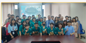
▲始業式開啟嘉義大學的國際史懷教學服務之旅

思。這些經驗使參與的師資生體會：當課程連結在地歷史、文化技藝與生活問題時，學生的參與與自我效能會明顯提升；而教師的角色，則更像是促進者與共同研究者。實踐服務後，師資生更理解尊重與同理如何落在備課、教學互動與社群協作，加速師資生的專業成長。