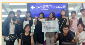
▲馬來西亞檳城機場

此計畫由嘉義大學師資培育中心於2024/8/11 - 8/25由當時的師培中心主任帶著九名正在修習中等教育學程的師資生，前往馬來西亞的吉打州雙溪大年新民獨立中學進行國際史懷哲的教學服務，共計為期15天。教學服務的內容包含：配合學校的商美周活動規劃三個跑台攤位教學、協助獨中運動會擔任裁判，以及高三升學講座，期間也進班試教。參與的團隊成員涵蓋中文、社會、自然、音樂、輔導等領域師資生。這次在個人培訓方面強調「觀課一試教一回饋一修正」循環，在跨域商美周活動方面，透過出國前培訓師資生，出國後與在地教師共備調整，讓師資生在教學服務過程中，深切體認史懷哲的服務精神。