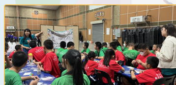
▲商美周辦理的活動，師資生擔任小組講師