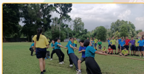
▲運動會活動，與新民獨中進行拔河友誼賽