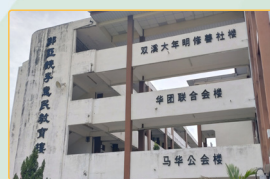
▲教學與行政辦公室位在主要校舍大樓內