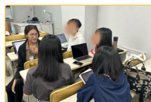
▲與京都大學同學進行小組議題討論