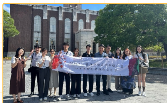
▲於京都大學代表地標下，兩校學生相見歡