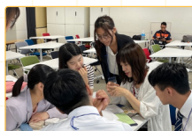
▲師培生在花園中學一同與日本老師探討臺日教學文化差異