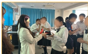
▲師培生以遊戲式教學方式來活化教學

本計畫成功促成國立中山大學與日本京都大學、京都花園中學之教育合作，建立雙方教育見習與學術交流的長期夥伴關係。師資生在見習期間共完成56小時課堂觀摩與7小時試教，實際參與京都大學教育學院的課程學習與跨文化教育研討會，並在花園中學進行臺灣文化主題教學，展現雙語教學與跨文化溝通能力。透過觀摩全英語授課與引導式教學模式，師資生深化對學生中心學習的理解，並反思自身教學方法。問卷調查顯示，師資生整體滿意度達99.4%，合作學校學生滿意度達84.6%。此外，計畫亦促成簽署臺日教育見習合作備忘錄，並在隔年（113年度）成功再次申請到國外見習計劃深化合作關係，並於今年邀請京都大學教授與日本老師們參與後續 APERA-TERA 2025國際研討會，持續推動雙邊教育合作與國際師資培育發展。