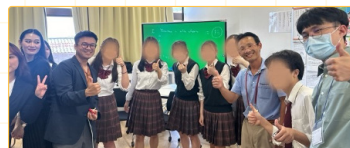
▲師培生與花園中學高中生合影留念