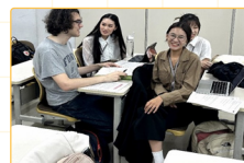
▲每組四位學生，彼此分享故事內容，並找出與文本中教學環境相關的理論與策略。