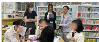
▲師培生在花園中學觀課

在京都大學與京都花園中學的見習期間，最深刻的印象來自於日本教育現場中理論與實踐的緊密結合。於京都大學教育學院旁聽課程時，師資生親身體驗到教授如何將教育心理學與學習策略理論應用於真實教學情境，並以問題導向的方式引導學生思考，展現了日本高等教育對「學術對話」與「批判探究」的重視。進入花園中學後，更深刻感受到日本文化融入學校教育的特質：課堂節奏沉穩，學生自律且主動，教師多以開放式提問引導學習，強調尊重、思考與反省。這種以學生為中心、重視內省與探究的教學文化，與台灣較強調教師主導的課堂形成鮮明對比。雖面臨語言與文化的挑戰，但在跨文化互動與雙語合作中，師資生逐漸理解教育的本質在於「以對話促進理解」，並體悟到成為具國際視野的教師所需的深度反思與靈活適應力。