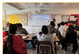
▲師資生教授環境永續課程