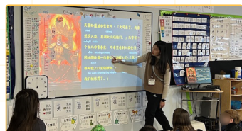
▲元育文化課程(中英雙語)

本計畫共補助8位師資生於PVCICS進行見實習，所有師資生每天在學校學校待上81小時，這些並不包含師資生每日回到旅館備課與撰寫報告時間。在校期間，師資生可以進入校內K-12所有課程觀課，故能深度理解該校對於雙語沉浸的教學策略，如何以雙語進行學科知識學習，以及IBDP各學科的教學實務；每位師資生完成至少2次上台教學，上台之前需要擔任授課班級的助教，並與指導教師討論課程進度與內容。這些課程也會透過師資生利用空檔互助合作，包括製作教具與學習單，優化課程學習效果與建立師資生間跨科互助情誼。