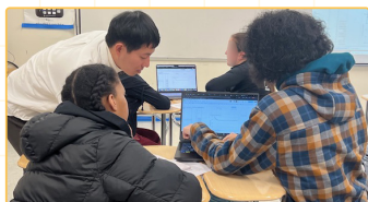
▲師資生教授高中數學