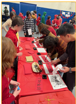
▲全校新年活動(中學部)

本次海外教育見習前往美國麻州先鋒中英雙語學校(PVCICS)，該校提供公立K-12教育，幼教與小學是以中文沉浸進行學習，中學部以英語進行學習，高中則採取全IBDP教育。見習於2025年春節期間完成15天的入校深度學習，八名師資生透過密集觀摩K-12教學現場、入班擔任助教，並主導至少兩次的實質教學活動。本次見習特點是讓師資生實際體驗中英雙語沉浸教學，須根據不同語言程度與文化背景的學生設計教學與進行互動；見習期間也要求學生深度和該校輔導教師探討探究設計、差異化教學及雙語模式的應用，並每日投入1至1.5小時的深度討論與300字反思札記。