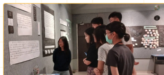
▲參與當地學生的畢業展