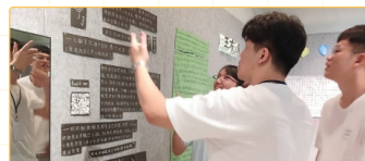
▲師資生進行回饋，交流想法