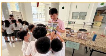
▲進行臺灣日文化交流活動

本計畫重點於雙方文化交流，透過與當地教師專業交流與課程合作，鞏固師資生的國際教育視野。除了語言能力的提升，師資生更能體會到文化間的尊重。