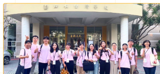
▲執行團隊泗水臺校前合影

在此次國外教育見習中，最令我印象深刻的是當地學校在教育制度與課程教學上的靈活與多元。首先，學校強調紀律與責任感的養成，學生每日需自行整理內務，顯示教育不僅關注知識學習，更重視生活習慣與品格培養。課程設計上，教師能依據學生學習狀況即時調整教學策略，面對語言與文化差異時，也善用肢體語言、數位媒材與同儕互助，讓教學更具包容性與適應性。此外，課堂中鼓勵學生自由提問、表達意見，展現出以學生為中心的教學理念。這些經驗讓我深刻體會到教育制度若能兼顧紀律與彈性，課程若能融合多元文化與學習需求，將更有助於學生的全人發展。