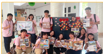
▲臺灣文化日交流活動