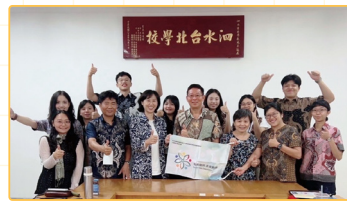
▲與泗水臺校校長及主任合照