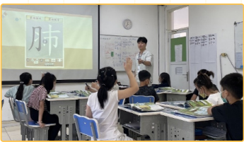
▲教師回答學生的疑問

師資生於見習期間進行課堂觀摩，學習如何運用是當的教學方法引導學生學習。在試教期間，師資生根據新課綱教科書實際教授國語文、數學等課程，強化教學的專業能力。同時，師資生學習如何與當地教師協同管理班級，包括維持班級秩序，管理學生行為等。