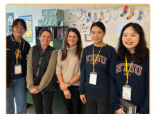
▲ Partner Classroom教師、行為分析師合照