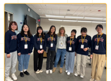
▲ Aquatics and Specials Safety 講座