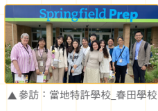
▲ 參訪：當地特許學校-春田學校