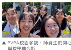
▲ PVPA校園參訪，師資生們開心與教學樓合影